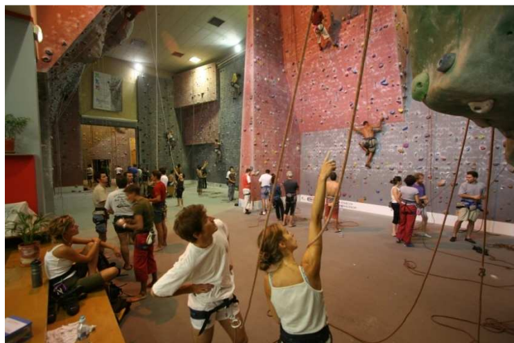
Ci-dessus l'Espace Escalade Altissimo de Toulouse Montaudran.

A l'image du réseau Altissimo, l'escalade indoor ne cesse de se développer : en libérant les amateurs des contraintes climatiques, la possibilité de pratiquer l'escalade en salle a drainé un public nouveau pour cette activité. La fréquentation des salles du réseau Altissimo en témoigne : la population urbaine dans son ensemble s'adonne à l'escalade en salle... En famille ou entre amis, cette pratique à la fois originale, sportive et ludique, attire toutes les tranches d'âges et offre un potentiel de développement hors du commun .