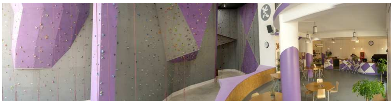
Ci-dessus : l'accueil de l'Espace Escalade Altissimo Odysseum de Montpellier.

Ouvertes 7j/7 et en accès libre, les salles d'escalade Altissimo s'adaptent à tous les emplois du temps. Sur place, l'accueil est assuré par une équipe de professionnels : conseils, accompagnement, cours privés ou collectifs, ils savent répondre à toutes les demandes. Pour ceux qui souhaitent s'équiper, une boutique spécialisée propose des articles soigneusement sélectionnés pour leur excellent rapport qualité / prix . Un espace petite restauration, l'accès gratuit à Internet et au WIFI et des expositions d'artistes assurent en prime aux visiteurs les conditions idéales du repos et de la détente.